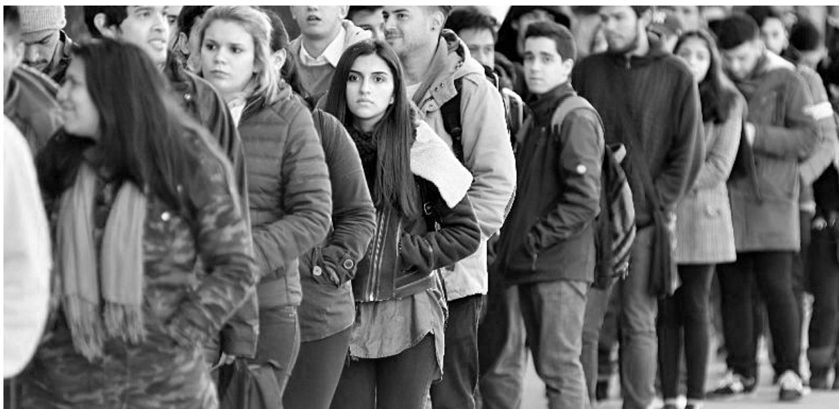
Jóvenes en busca de trabajo

El gobierno dejó de pagar el Plan "Progresar" (Programa de Respaldo a Estudiantes de Argentina) de un día para el otro. Cientos de miles de estudiantes fueron a sacar plata del cajero a principios de junio y vieron que no tenían un peso. La política del gobierno de "si pasa, pasa" tuvo un nuevo capítulo. Ahora los funcionarios salen a decir que van a solucionarlo; el problema es que nunca debió haber pasado. Es más, si no fuera por los propios estudiantes que, como en Mendoza se movilizaron al Anses (organismo que otorga las becas), o empezaron a reclamar en sus universidades y por las redes sociales, desde el gobierno no habrían informado absolutamente nada. Esperaron a ver si había respuesta de los estudiantes