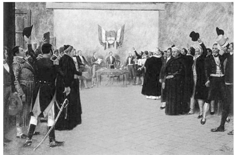
Los congresales reunidos en Tucumán para la Declaración de la Independencia en 1816. Pintura de Francisco Fortuny

Dentro de un proceso muy complejo, lleno de obstáculos, la declaración de la independencia de las Provincias Unidas constituyó un hito fundamental en relación al objetivo de impulsar la campaña libertadora del Ejército de los Andes- iniciada