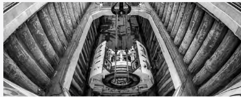
La tuneladora en Haedo

controladora de Iecsa y Creaurban, que Calcaterra compró en 2007 al grupo Socma, propiedad de su tío Macri. Por otra parte, Ghella tiene como antecedente la realización del túnel del arroyo Maldonado, la obra insignia de Macri durante su gestión en la ciudad.