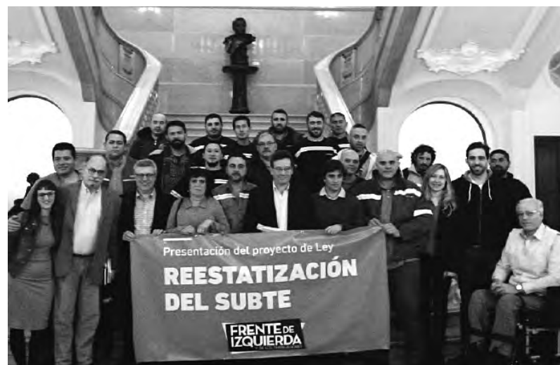
Trabajadores del subte junto a referentes del FIT apoyando el proyecto

El proyecto de ley del FIT establece, además, que se deberán estudiar los balances y la utilización de los subsidios estatales recibidos por Metrovías S.A. durante más de veinte años. De acuerdo a los resultados, se obligará al grupo Roggio a pagar indemnización por los años de saqueo al subterráneo, y que estos fondos, junto a lo recaudado por el cobro de impuestos a las grandes empresas radicadas en la ciudad,