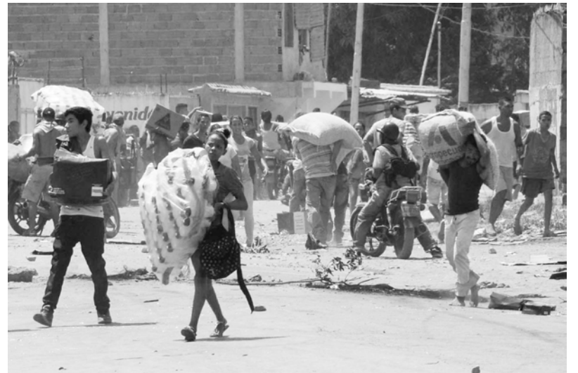
Saqueos masivos en Maracay el 27 de junio

Maduro acaba de aumentar el salario mínimo en un 50%, llevándolo a 95 dólares mensuales según la tasa oficial (Dicom) y a 32 dólares al tipo de cambio paralelo. Desde la llegada de Maduro al poder en 2013, la moneda venezolana ha perdido el 99,7% de su valor. El ajuste inflacionario del gobierno, quien ha generado miles de millones de bolívares sin respaldo y ha recortado las importaciones de 70 mil millones de dólares en 2012 a un estimado de 20 mil millones para este año, ha destruido los salarios. Se paga con el hambre del pueblo los servicios de la deuda externa, más de 60 mil millones de dólares en los últimos tres años, y las transnacionales hacen un festín con el entreguismo: Barrick Gold recibió concesiones en el Arco Minero del Orinoco, Chevron usufructúa concesiones por 40 años y Goldman Sachs recibió el mes pasado 2,8 mil millones de dólares en bonos de Pdvs, pagando apenas 865 millones. En cinco años estos banqueros yanquis multiplicarán por tres lo invertido y Wall Street ha constatado que Maduro está dispuesto a exprimirle al pueblo hasta la última gota de sudor y sangre para pagar la deuda.