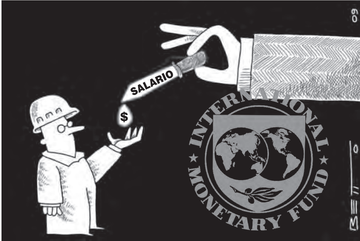
Más deuda externa pagamos, más se achica el salario

Candidato a diputado nacional por la Ciudad de Buenos Aires