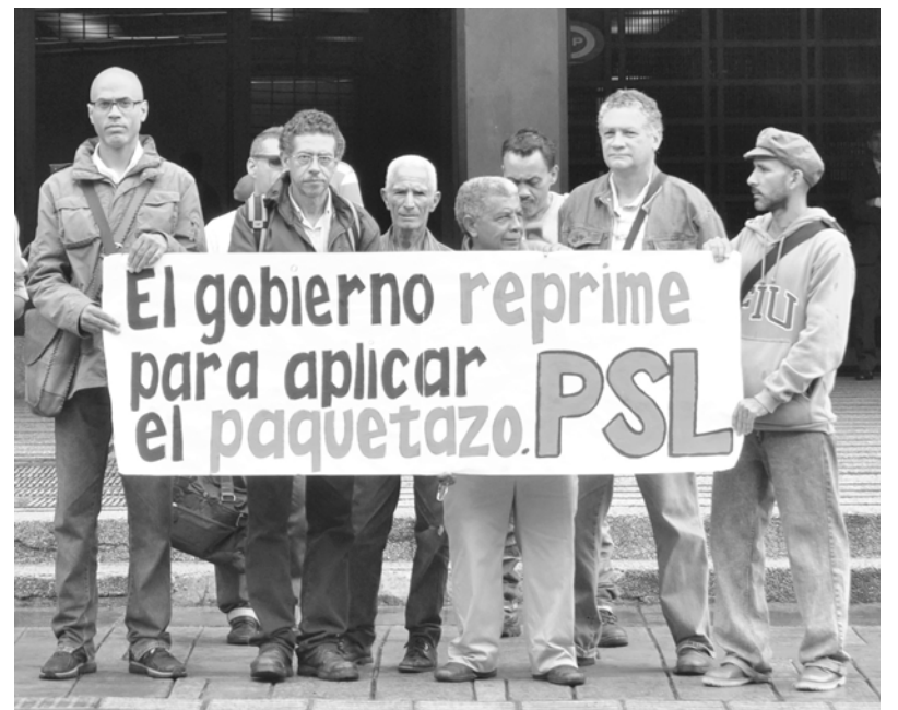
El Partido Socialismo y Libertad en protesta autónoma contra la represión ante la Fiscalía General en Caracas