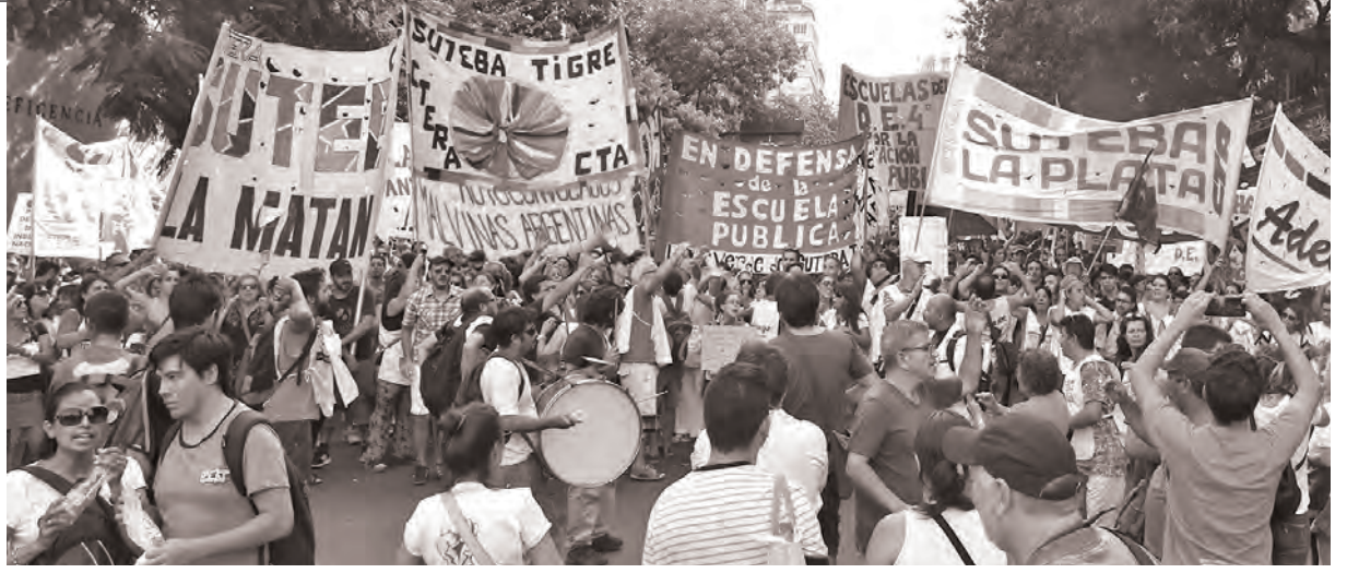
Movilización de los Sutebas Multicolor